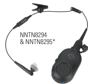
NNTN8294 & NNTN8295*

L'audio Bluetooth 2.1 è integrato nella radio per consentire l'accoppiamento rapido e sicuro con una varietà di accessori Bluetooth. Semplici da collegare e abbinare, gli accessori Bluetooth Motorola Solutions migliorano le prestazioni e la sicurezza in qualunque ambiente di lavoro. Gli agenti possono comunicare in maniera discreta quando sono in incognito, spostarsi senza l'ingombro di cavi e usare la loro radio come mai prima.