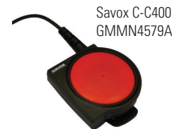
Savox C-C400 GMMN4579A

La soluzione si può completare con l' unità di controllo Savox C-C400 che consente l'uso della radio bidirezionale in condizioni di pericolo. Studiata per essere particolarmente robusta per l'uso negli ambienti più estremi, il grande pulsante PTT garantisce la trasmissione anche se utilizzato sotto gli equipaggiamenti e gli indumenti protettivi.