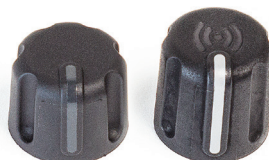
Manopola di controllo standard Manopola di controllo RFID

◀ Anelli identificativi colorati opzionali per gruppi impegnati in mansioni, aree di copertura o turni differenti