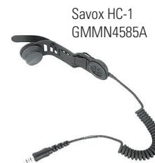
Savox HC-1 GMMN4585A

Il Savox HC-1 è un'unità compatta combinabile con casco per i professionisti che lavorano in condizioni rischiose. Si monta facilmente sulla maggior parte degli elmetti e offre comunicazioni chiare e a mani libere che lo rendono un accessorio particolarmente adatto a vigili del fuoco e squadre di salvataggio.